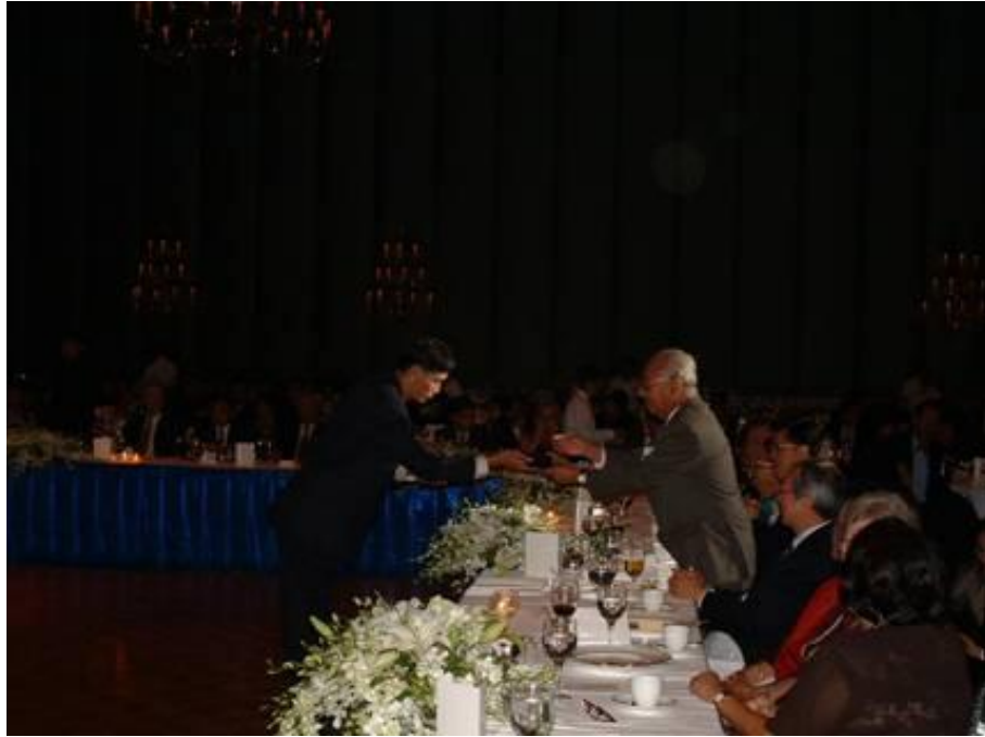
PTIT AWARD ประเภท Young Scientist ประจำปี 2546-2547 จากสถาบันปิโตรเลียมแห่งประเทศไทย เข้ารับรางวัลจาก ฯพณฯ ท่านองคมนตรี กำธน สินธวานนท์