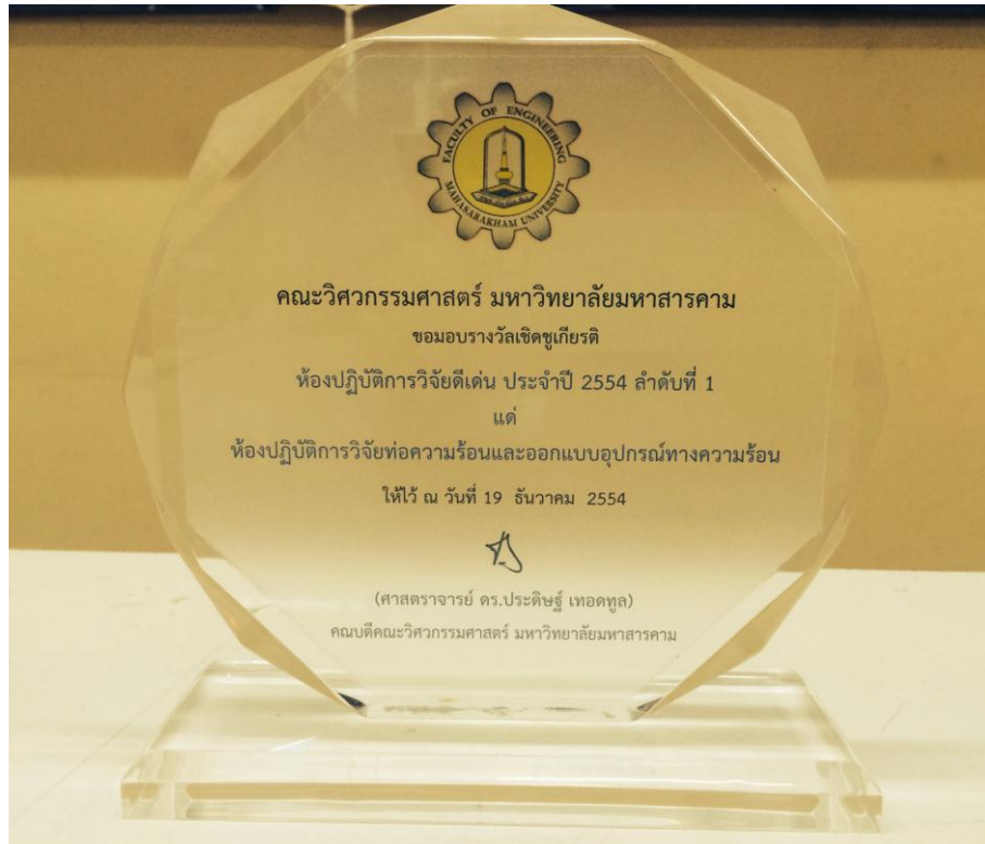
รางวัลห้องปฏิบัติการวิจัยดีเด่น คณะวิศวกรรมศาสตร์ มหาวิทยาลัยมหาสารคาม 2554