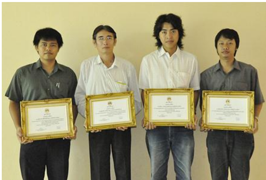
รางวัลชมเชย ผลงานวิจัยและวิชาการ ด้านสิ่งแวดล้อม (พลังงานทดแทน) จากสภาวิศวกร ประจำปี 2554