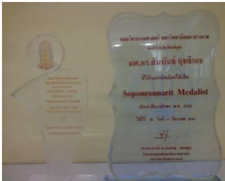
รางวัลนักวิจัยดีเด่นคณะวิศวกรรมศาสตร์ ประจำปี 2549-2550