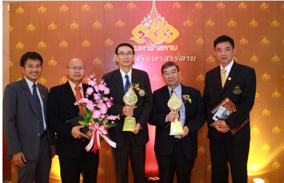
รางวัล 150 ปี คณบดีศรีนครินทรวิโรฒ จากจังหวัดมหาสารคาม ประจำปี 2558