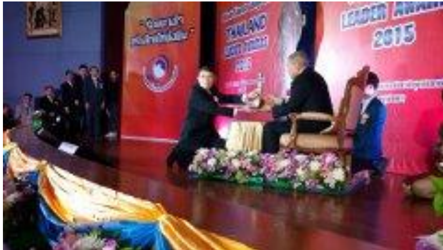
รางวัล THAILAND LEADER AWARDS 2015 สาขาส่งเสริมและพัฒนาการศึกษา จากสมาพันธ์สื่อสารมวลชนแห่งประเทศไทย เข้ารับรางวัลจาก ฯพณฯ ท่านองคมนตรี พิจิตร กุลละวณิชย์