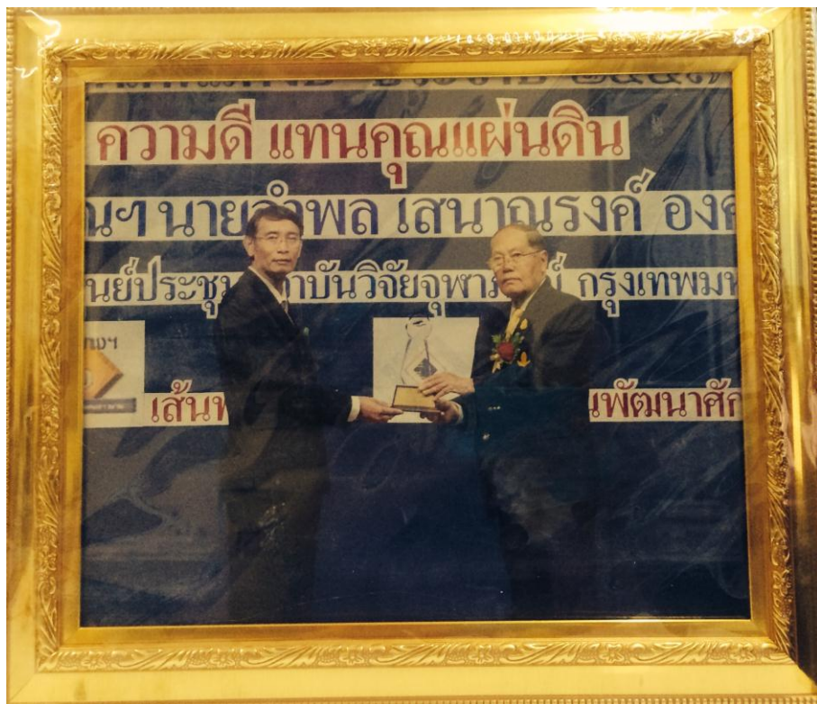
รางวัลนักบริหารดีเด่น สาขาวิจัยและพัฒนา จากรางวัลไทย ประจำปี 2557 เข้ารับรางวัลจาก ฯพณฯ ท่านองคมนตรี อำพล เสนาณรงค์