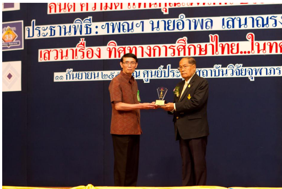
รางวัลคนดี ความดี แทนคุณแผ่นดิน สาขาวิศวกรรมศาสตร์ จากรางวัลไทย ประจำปี 2558 เข้ารับรางวัลจาก ฯพณฯ ท่านองคมนตรี อำพล เสนาณรงค์